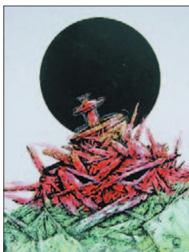
La fontana disegnata da Philippe Druillet

Con gli originali offerti dagli artisti Spoletto allestirà una "mostra-mercato". Le opere saranno esposte da domani (fino al 2 maggio) a Palazzo Collicola, sede della Galleria civica d'arte moderna, e in seguito (dal 22 maggio al 13 giugno) saranno trasferite a Perugia, al Centro espositivo della Rocca Paolina. I disegni sono in vendita, chi vorrà acquistarli contribuirà al restauro della fontana aquilana. Per rimetterla a posto il prezioso monumento del Trecento, secondo il progetto dei Beni culturali, ci vogliono 50 mila euro.