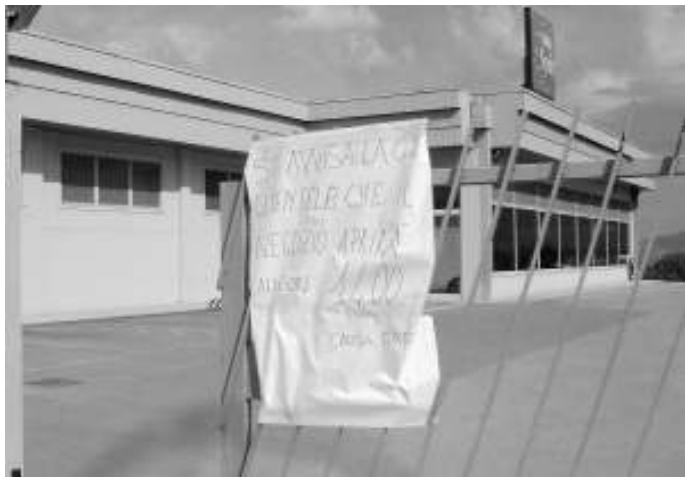
Il supermercato dove si è verificato il furto