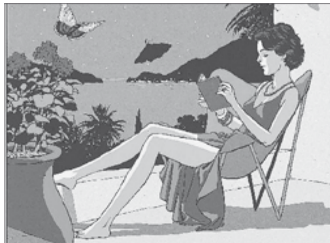
Nuit d'été Tavola di Vittorio Giardino (Max Fridman)